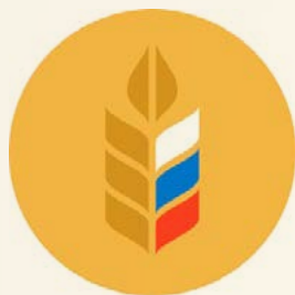
Министерство сельского хозяйства