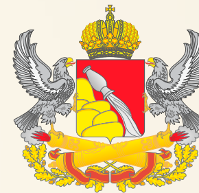
Правительство Воронежской области